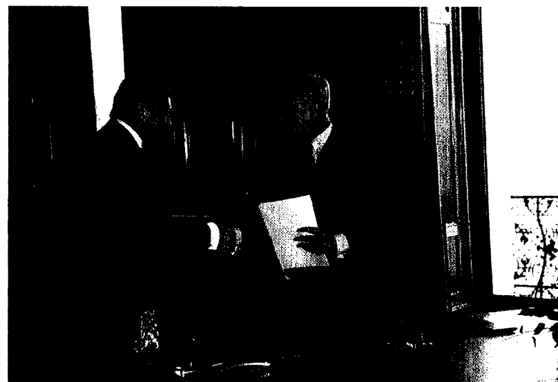
Глава города Калининграда Ярошук А.Г., бургомистр Гамбурга фон Бойст О.

Помимо проектов, связанных с экономикой порта, обсуждались и другие важные темы, такие как защита окружающей среды, образование, культура. В рамках соглашения обе стороны планируют содействовать развитию туристической деятельности двух городов, культурному обмену, организовывать совместные молодежные и спортивные мероприятия.